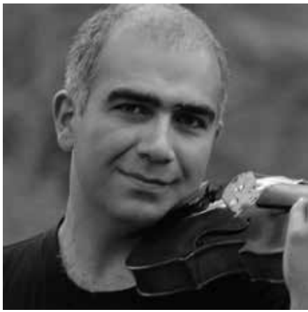
MOVSES POGOSSIAN (VN)

モブセス・ポゴシアン - ヴァイオリン 米国ロサンゼルスUCLA大学教授、ディリジャン・チェンバーシリーズ・芸術監督。