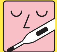
入場時、検温の実施

主催＝公益財団法人豊橋文化振興財団 共催＝豊橋市 助成＝文化庁 (劇場・音楽堂等機能強化推進事業) 協賛＝独立行政法人日本芸術文化振興会